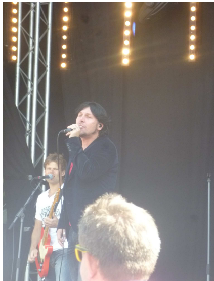
De 3 J's