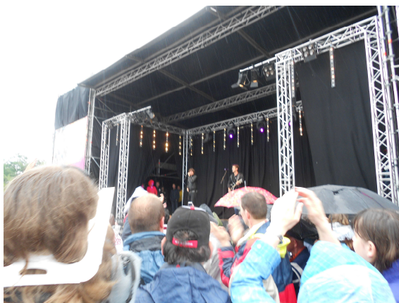
(beetje druk bij)